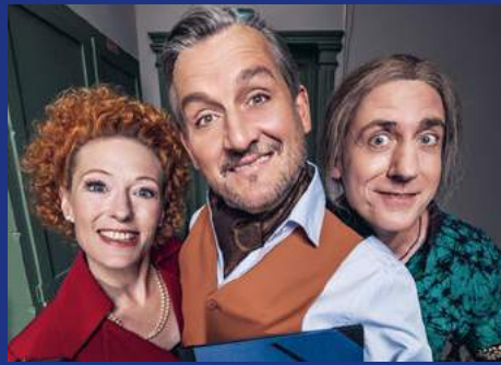
»Skandal im Spreebezirk« KABARETT THEATER DISTEL 17. September 19.30 Uhr / 18. September 18 Uhr