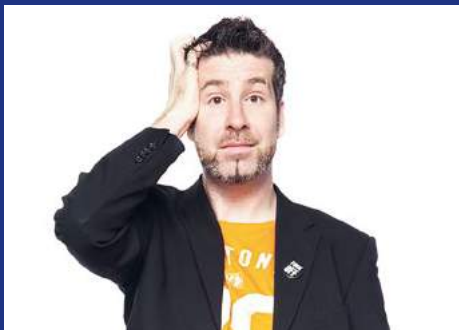
»Ich hab die Schnauze voll« TORSTEN SCHLOSSER 23. und 24. September 19.30 Uhr

Torsten Schlosser macht sich frei von den Erwartungen des Publikums, der Gesellschaft und dem Streben nach einem politisch korrekten Leben. Wenn alles gut geht, wird daraus ein Abend wie in einer Prager Absinth-Bar: abenteuerlich, ungewöhnlich, berauschend – und am Ende bleibt man verwirrt im Rinnstein zurück.