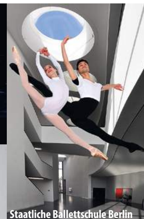
Staatliche Ballettschule Berlin