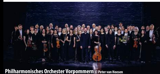
Philharmonisches Orchester Vorpommern