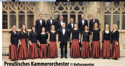
Preußisches Kammerorchester