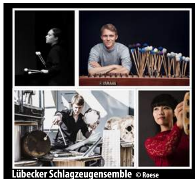
Lübecker Schlagzeugensemble