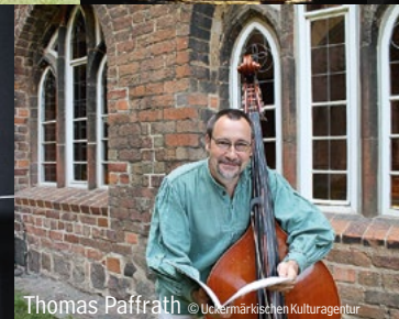
Thomas Paffrath © Uckermarkische Kulturgesellschaft