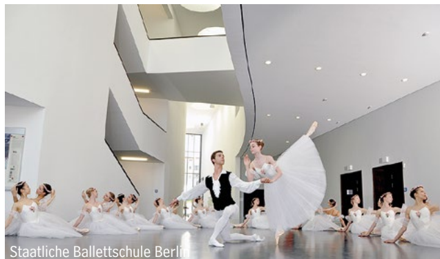
Staatliche Ballettschule Berlin