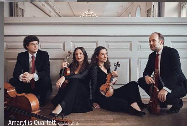
Amaryllis Quartett