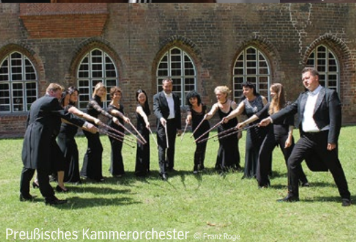
Preußisches Kammerorchester