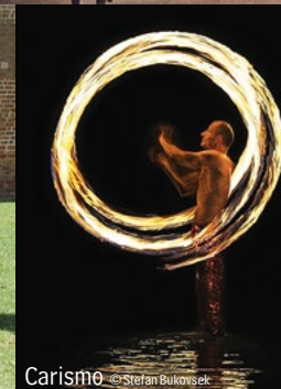
Carismo © Stefan Bukowski