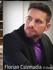
Florian Csizmadia © Oswin