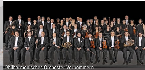
Philharmonisches Orchester Vorpommern