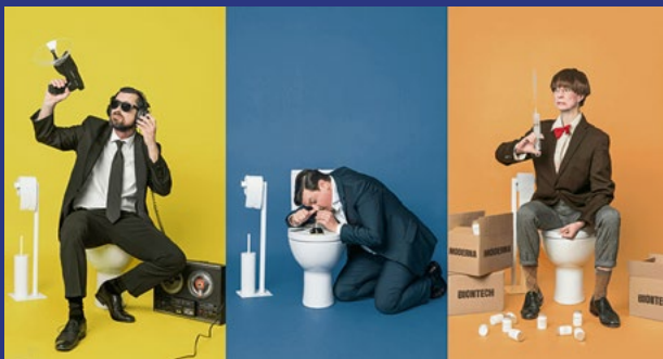
Im Hinterzimmer der Macht Eine schwindelige Bundestags-Revue KABARETT DISTEL BERLIN 13. und 14. September, 19.30 Uhr

Früher fiel in Krimis oft der herrliche Satz: „Der ist bei der Sitte“. Diese Zeiten sind vorbei. Dafür sind heute Hunderttausende unterwegs, um die Moral ihrer Mitmenschen zu bewachen und in den sozialen Medien zu kommentieren. Die schiere Anzahl ehrenamtlicher Bedenkenträger, zeigt: Selten war ein Strolch so notwendig wie heute!“ Man ahnt: Das kann ja heiter werden – so sehr, dass danach wieder getwittert wird.