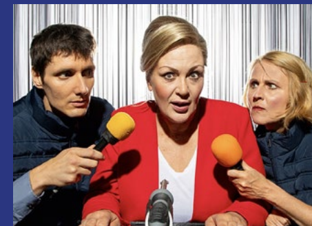
Steglitz, wir haben ein Problem! Wie Berlin zum Mars flog. DIE STACHELSCHWEINE 10. und 11. Oktober, 19.30 Uhr